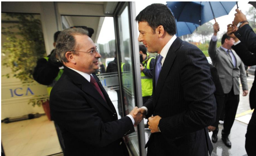
Paolo Astaldi, Presidente del Gruppo Astaldi, e Matteo Renzi

Il Gruppo Astaldi, attivo in Turchia dal 1986 e 3° Contractor al mondo per fatturato prodotto nel comparto dei ponti, è diventato uno dei principali player nel settore delle infrastrutture di questo Paese ed è attualmente coinvolto nella realizzazione di importanti progetti. Nel medio termine, Astaldi e i suoi partner locali, porteranno a termine – oltre al Terzo Ponte sul Bosforo – anche la costruzione di 500 Km di reti autostradali e del più esteso complesso ospedaliero d'Europa.