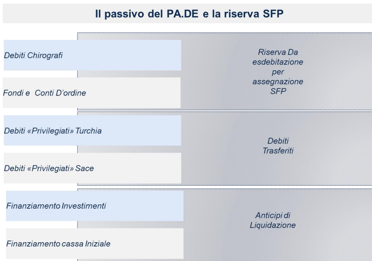
FIGURA 2: RAPPRESENTAZIONE SINTETICA DEL PASSIVO PATRIMONIO DESTINATO E DELLA RISERVA SFP

Costituiscono il Patrimonio Destinato anche tutti i beni, i diritti e i rapporti giuridici (attivi e passivi) che verranno ad esistenza e sorgeranno a qualsiasi titolo nel corso e per effetto della gestione dello stesso Patrimonio Destinato. Di contro, sono espressamente esclusi dal Patrimonio Destinato tutti i rapporti giuridici, i diritti, i crediti, gli oneri e gli obblighi anche di garanzia, contro-garanzia e manleva di Astaldi relativi alla sola esecuzione dei lavori affidati dalla Società Etlik, dalla Società NPU, dalla Società Salud, dalla Società GOI e dalla Società Terzo Ponte, direttamente ad Astaldi ovvero a joint venture , consorzi o società in qualunque forma giuridica costituiti con la partecipazione di Astaldi.