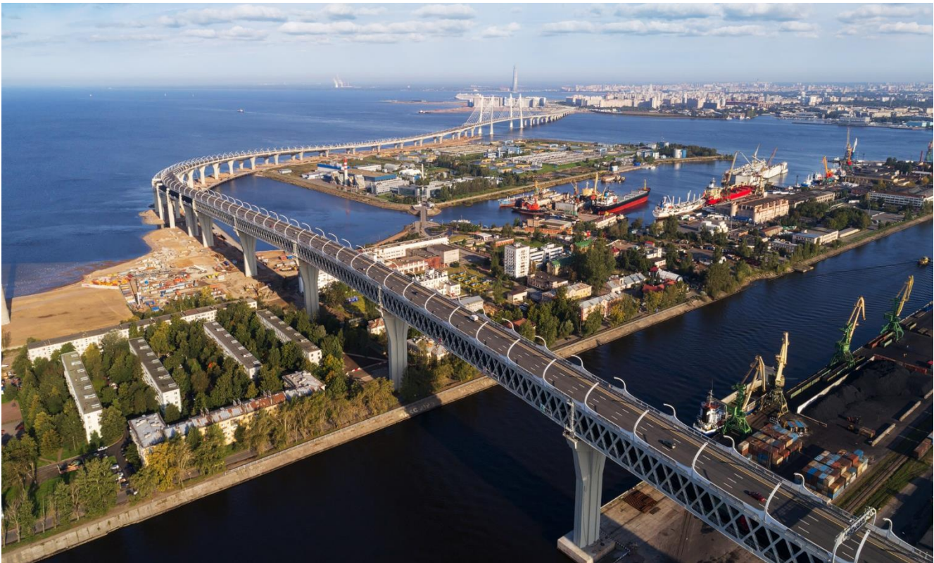
FIGURA 2: AUTOSTRADA GEBZE OTOYOL IZMIR (GOI) - TURCHIA