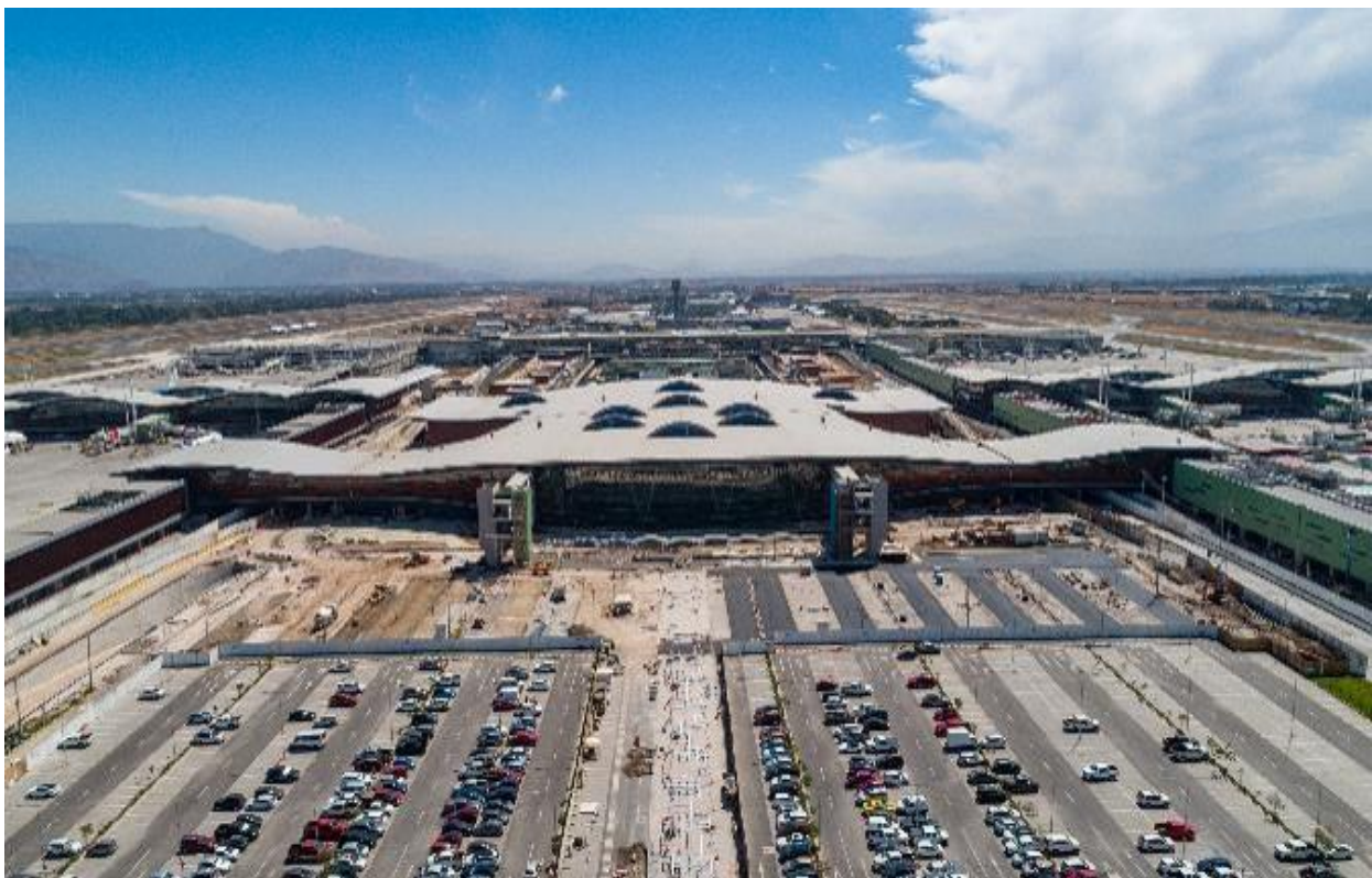
FIGURA 3: SANTIAGO AIRPORT – CHILE