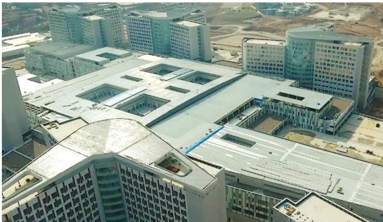
FIGURA 1: ETLIK HOSPITAL - TURCHIA