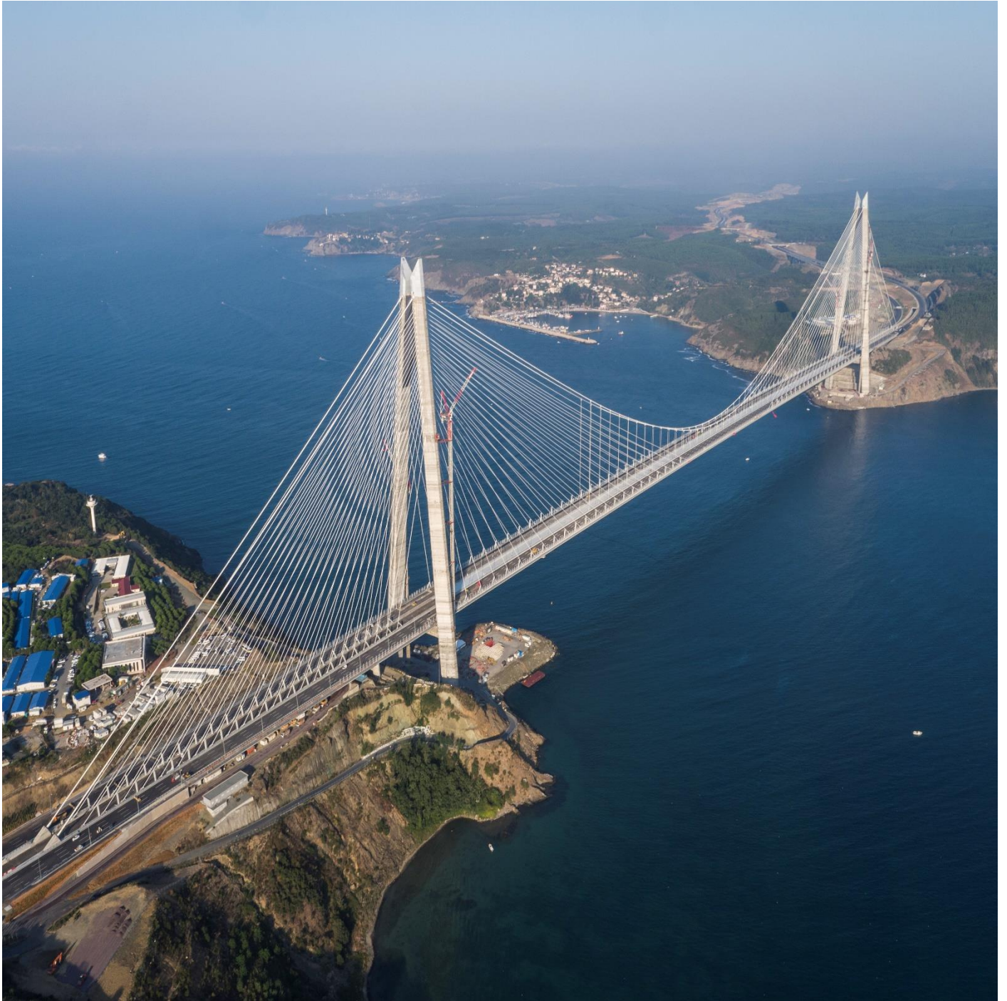
FIGURA - TERZO PONTE SUL BOSFORO - TURCHIA